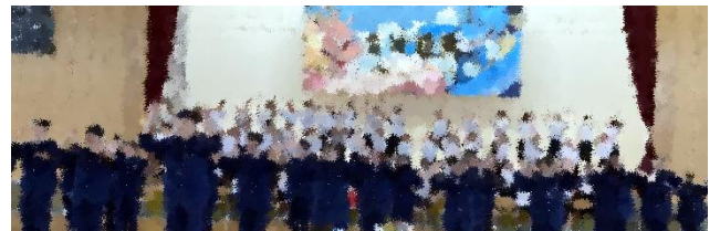
《最優秀賞：青団の演技》