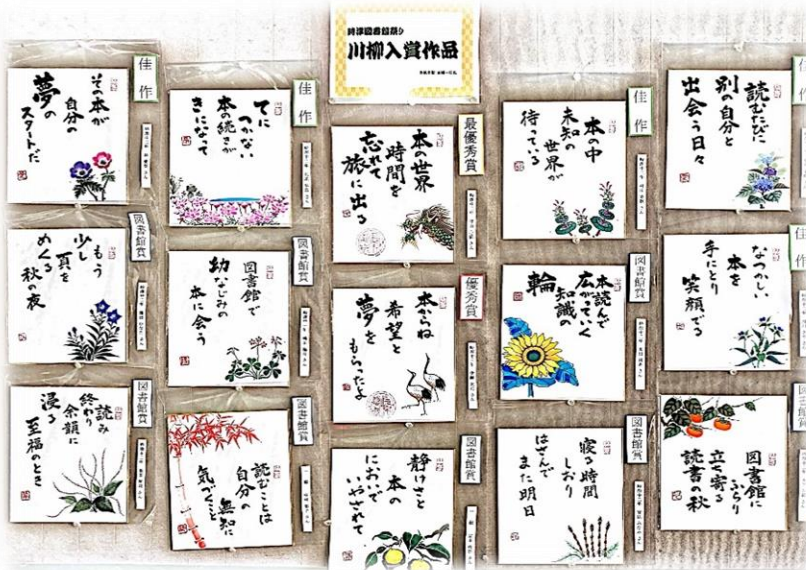
↑生徒玄関前オープンスペースに掲示しています。

『時津町図書館祭り』の読書に関する川柳に応募した本校生徒及び職員の商品が入賞しました。