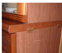
家具の上下を金物で固定。