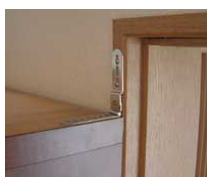
金物で家具を壁に固定。