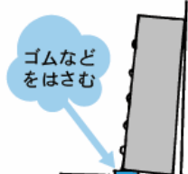
家具を壁側に傾けることで転倒を防ぐ。